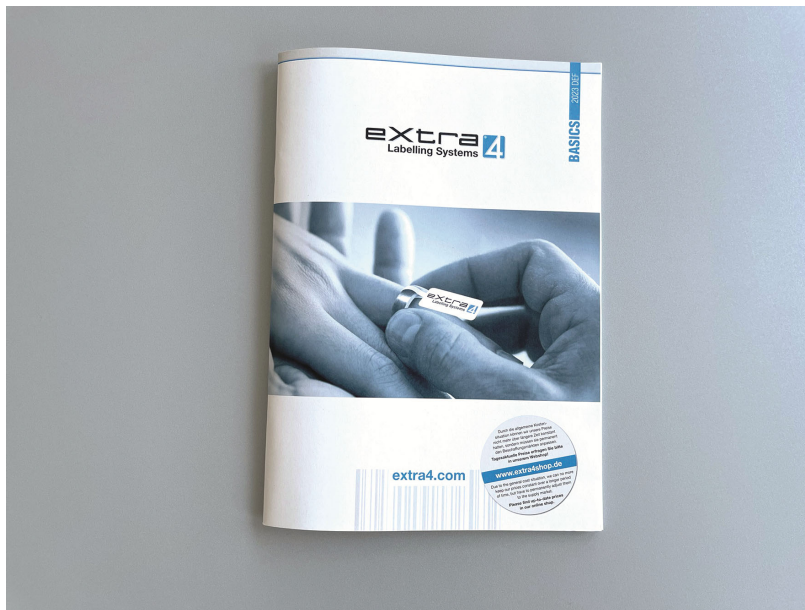
Abb.2: Titel vom zur Herbst-Messesaison 2023 aktualisierten Lager-Katalog von eXtra4 Labelling Systems